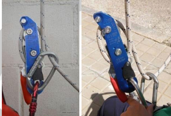
Posición 0, no permitida